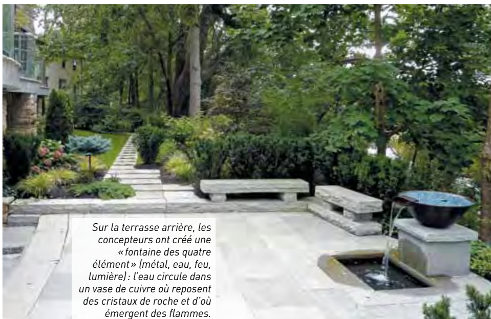
Sur la terrasse arrière, les concepteurs ont créé une « fontaine des quatre éléments » (métal, eau, feu, lumière): l'eau circule dans un vase de cuivre où reposent des cristaux de roche et d'où émergent des flammes.

la proportion du nombre d'or: 1 \times 1,618 et des poussières. Le nombre d'or sert non seulement à décider de la taille des pièces, mais aussi de la plupart des rapports, même en élévation. Nous apportons des corrections aux angles droits créés par la rencontre de deux murs, ou des murs et du plafond, parce que cette forme bloque la circulation de l'énergie et donne naissance à une force dessiccative, désastreuse