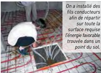
On a installé des fils conducteurs afin de répartir sur toute la surface requise l'énergie favorable trouvée dans un point du sol.